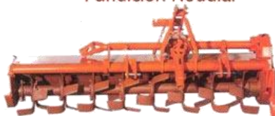
Rotocultivador Modelo VM DESPLAZADO