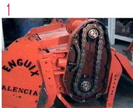
Transmisión de Cadena Reforzada