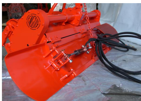
Aripi mobile hidraulice