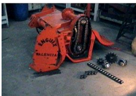
3 Detalle Rodamientos, piñones y cadena reforzada 1 1/2 "