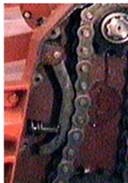
Detalle Tensor automático cadena