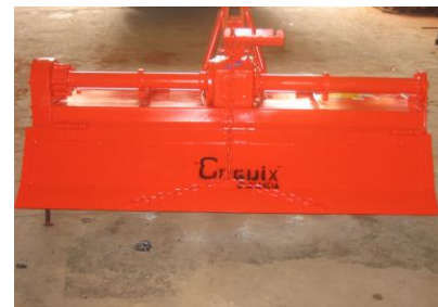
Vedere din spate