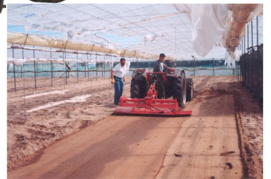
Lucru in sere cu aripi mobile