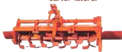
Rotocultivador Modelo VM CENTRADO