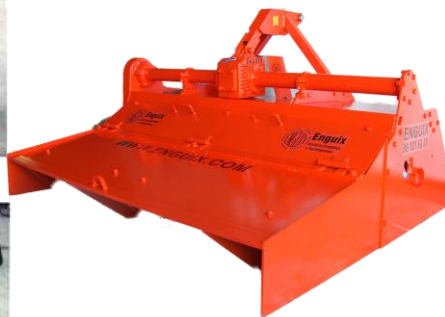
Optional masina de făcut brazdă fixă