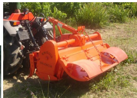
Vedere din lateral cu aripi mobile mecanice