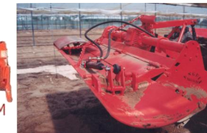
Aripi mobile hidraulice