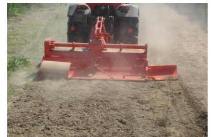
Aripi mobile mecanice